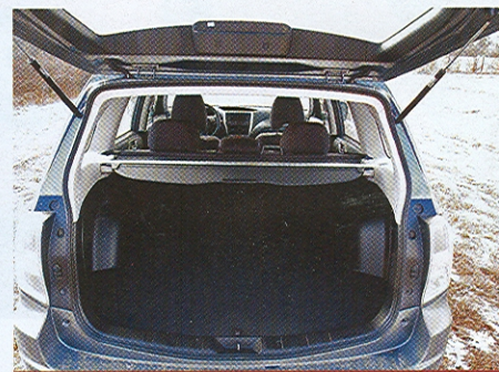
Zavazadlový prostor je dobře přístupný, ale je docela mělký

a zatím v jediné výkonové variantě 108 kW/147 k. Na rozdíl od zážehového agregátu pak je pro tento motor určena pouze šestistupňová přímo řazená převodovka bez možnosti zařazení redukce. Ovšem nechybí „hill assist“, tj. elektronická pomůcka pro sjíždění prudkých svahů, tempomat, automatická klimatizace, el. ovládná okna i boční zrcátka s vyhříváním, el. vyhřívání nejen zadního ale i čelního skla, ostřikovače světlometů a další drobnosti. To vše už v základní výbavě Active. Pokud jde o design, nový Forester získal nejen novou, zcela přepracovanou masku, ale také jiná koncová světla. Jinak se stále jedná o „větší“ kombík. Přepracován byl i interiér, zvláště palubní deska má nový design, ale vše je v podstatě na svém původním místě, tj. dobře „po ruce“, nic není potřeba nějak zvlášť hledat. Volant je seřiditelný ve dvou rovinách, sedadlo řidiče nepostrádá ani výškové nastavení. Takže pohoda, a řidiče potěší i dobře tvarované sedadlo – snad jenom ten sedák by mohl být o něco delší. Dílenské zpracování je dobré, ani na horších silnicích či polních cestách nikde nic nevrzalo a neskřípalo. Škoda, že kulisa řazení není příliš přesná. Kdo rád využívá výkon motoru a jezdí sportovnějším stylem, asi by si přál tvrdší odpružení. A mimochodem, s ohledem na trvalý pohon všech kol a meziná-