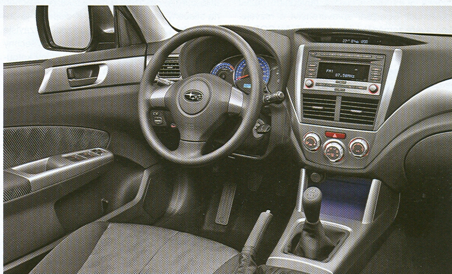
Palubní deska také zaznamenala facelift. Potěší dobře seřiditelný volant.

„až po střechu“ je k dispozici objem 1,6 m 3 s užitečnou hmotností cca 500 kg. Připojit lze ještě brzděný přívěs o celkové hmotnosti až 2000 kg. A to je hodnota v této třídě opravdu solidní. A ještě jedna „rozměrová“ poznámka: ačkoliv má Forester světlou výšku 215 mm, nejde o žádný off-road, i když mimo zpevněné vozovky dokáže opravdu hodně, zvláště, když má vhodné pneumatiky.