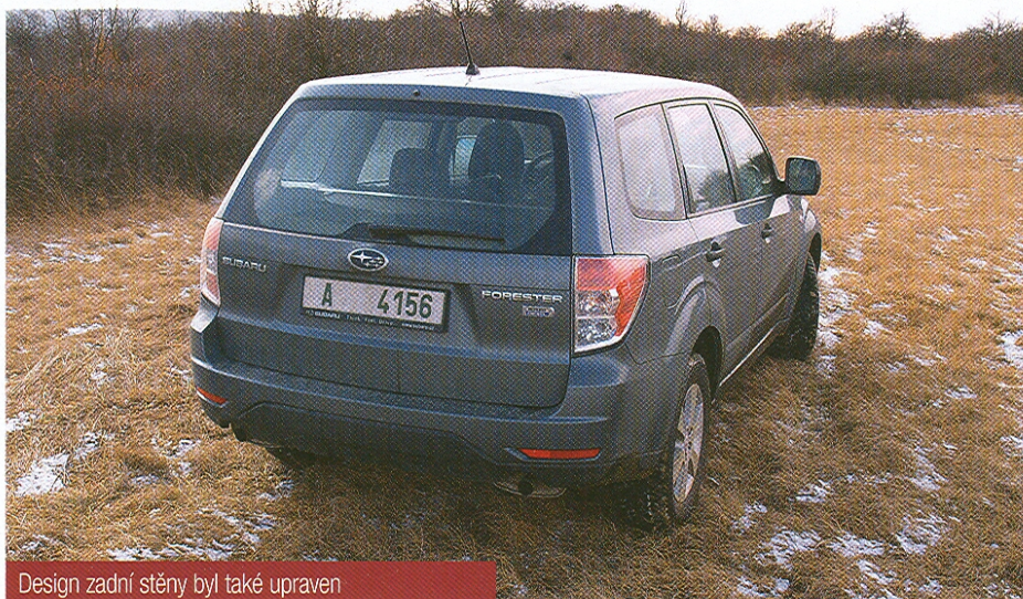
Design zadní stěny byl také upraven