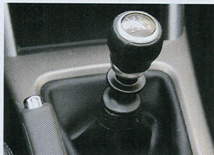
Šestistupňová převodovka je přesná, řadí ale mírně ztuha. Dolů jsme si pomáhali meziplýnem.