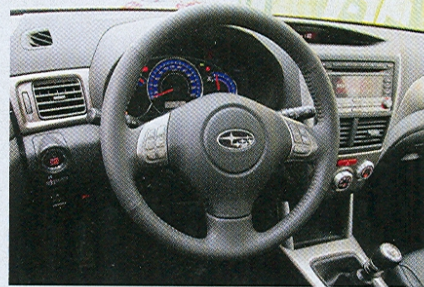
Kvalita materiálů i celkový dojem za konkurenci trochu zaostává. Volant lze nastavovat dvouose.