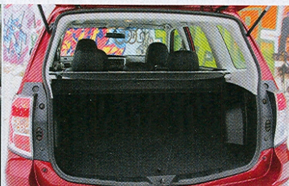
Objem 450 l je ve třídě SUV průměr. Po sklopení vzroste kapacita na 1610 l.