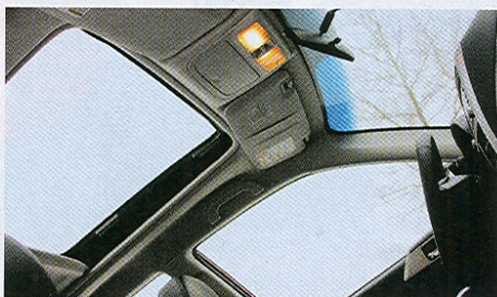
Panoramatické střešní okno s elektrickou roletkou je u výbavy Executive v základu.