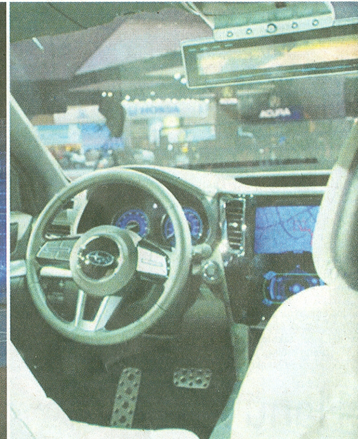
Interiér je koncipován pro přepravu čtyř osob.