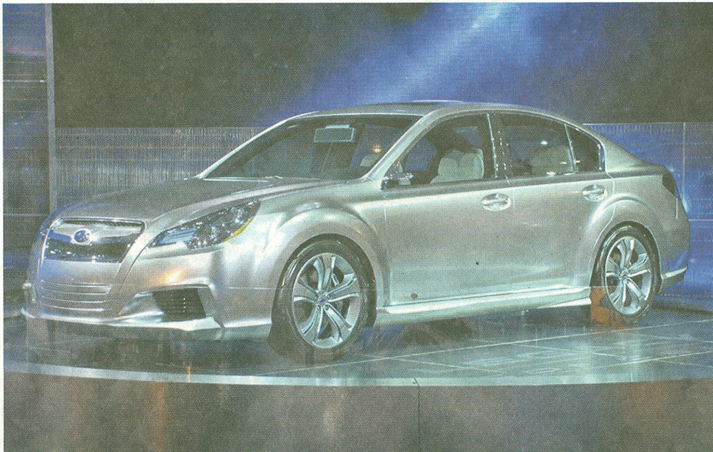
Studie Subaru Legacy je dlouhá 4796, široká 1820 a vysoká 1500 mm při rozvoru 2750 mm.