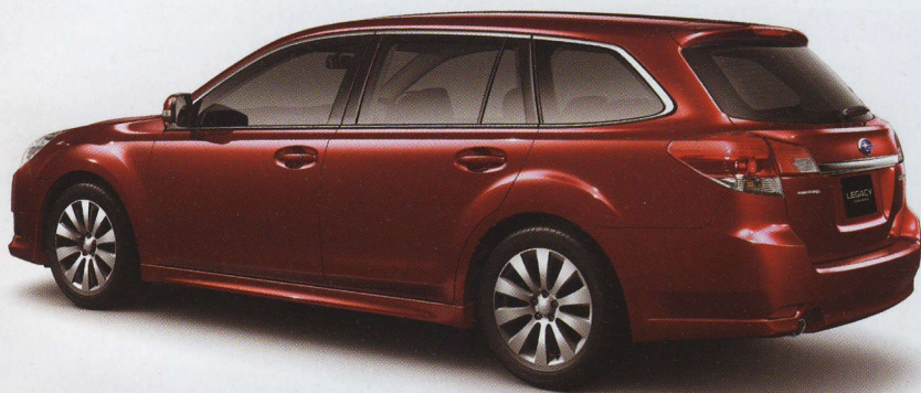
» Propojené prosklení nahradil výrazný D sloupek

Tradičně silnou zbraní Subaru bude zajímavá motorová paleta čítající, jak jinak, pouze motory s uspořádáním boxer. Roli základní motorizace má za úkol přepracovaný atmosférický dvoulitr plnicí nově normu Euro 5 s výkonem 150 koní. Další možností je 2,5litr (167 k/229 Nm) dodávaný standardně s převodovkou Lineartronic. Řadu benzinových motorů ukončuje s pětistupňovým automatem dodávaný 2,5litrový turbomotor (265 k/350 Nm), který