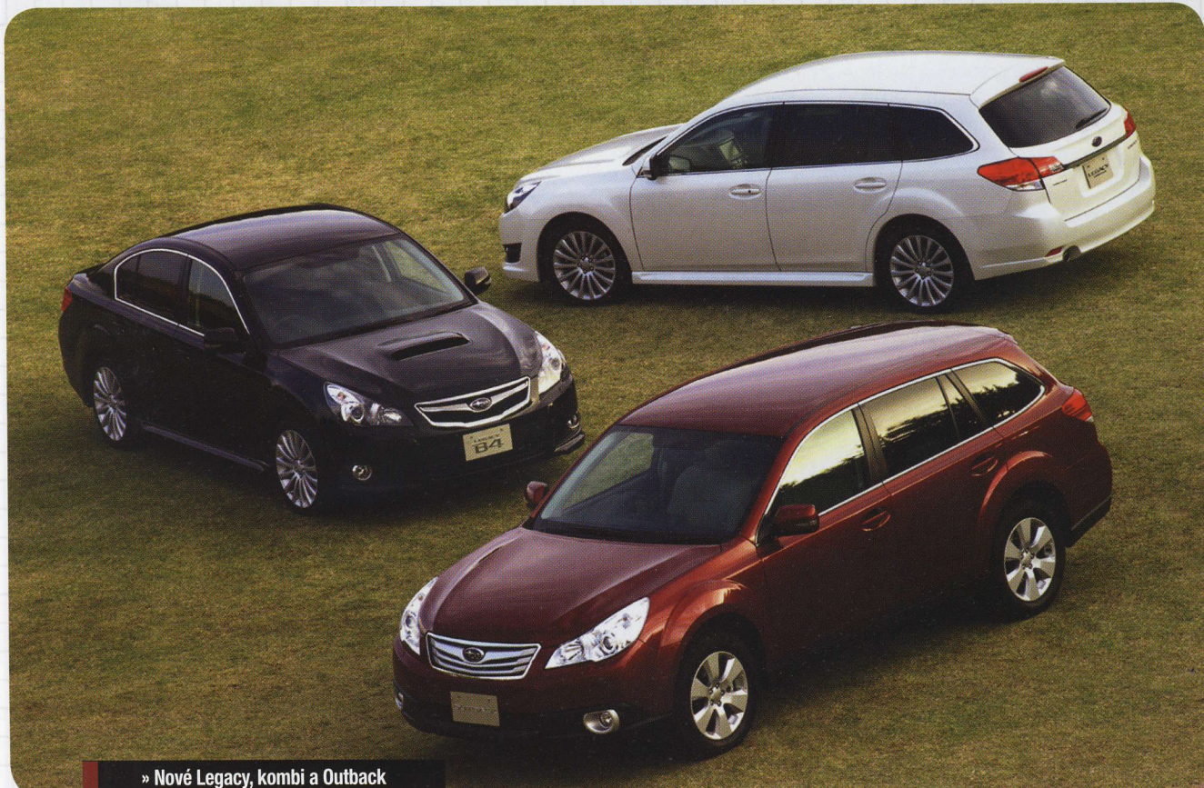
» Nové Legacy, kombi a Outback

Legacy i jeho vyšší dvojče Outback jsou pro Subaru velmi úspěšnou řadou, během čtyř dosud vyráběných generací se jich celosvětově vyrobilo více než 3,6 milionu (do konce roku 2008) a nová pátá generace by měla v tomto úspěšném tažení pokračovat.