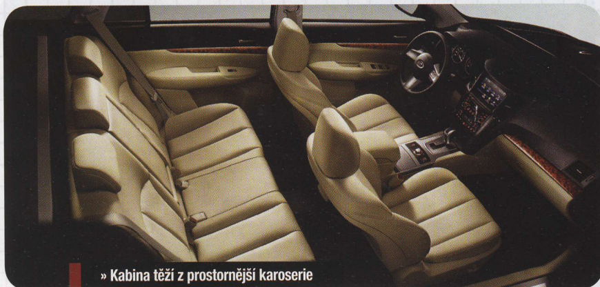
» Kabina těží z prostornější karoserie

SUBARU LEGACY LETOS OSLAVILO DVACÁTÉ NAROZENINY A MOŽNÁ I TO BYL DŮVOD K PŘEDSTAVENÍ NOVÉ GENERACE PRO MODELOVÝ ROK 2010, KTERÁ SE UŽ VE FORMĚ VELMI REALISTICKÉ STUDIE OBJEVILA NA LETOŠNÍM ŽENEVSKÉM AUTOSALONU. NOVÉ AUTO JE HODNĚ JINÉ, S TĚMI DŘÍVĚJŠÍMI HO SPOJUJE PRAKTICKY JEN ARCHITEKTURA POHONU.