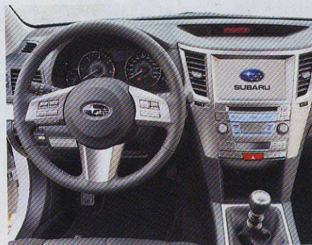
Ve výbavě nechybí samočinná parkovací brzda a hill-holder. Ten na rozdíl od konkurence drží vůz ve svahu do chvíle, než řidič šlápně na plyn, nikoli pouhé tři sekundy.

Volant má tlustý věnec, hrana-tá ramena a středovou konzolu kryje eloxovaný hliník. Kožená sedadla jsou pohodlná, boční ce opěradel by mohly být tuš-