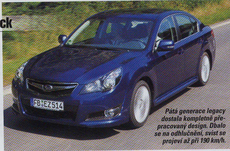
Pátá generace Legacy dostala kompletně přepracovaný design. Dbalo se na odhlučnění, svist se projeví až při 190 km/h.

V souladu s trendem doby Subaru Legacy a Outback celkově narostly. Zároveň dostaly komfortnější podvozek, rozsáhlejší výbavu a lepší jízdní vlastnosti.