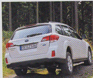
Světlost 200 mm a velké nájezdové úhly zaručují Outbacku dobrou průchodnost terénem. Karoserie se ani na velkých nerovnostech nekroutí. Zavazadelník narostl o 67 l na 0,526 m 3 .

Legacy a Outback přidaly na komfortu. Sice přišly o bezrámové dveře, získaly však prostornější kabínu a pohodlný podvozek.