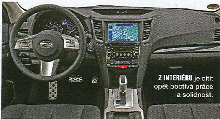
Z INTERIÉRU je cítit opět poctivá práce a solidnost.

se skrývají nekonvenční, pouze ploché motory a všechny modely pohání pohon všech kol. Pod kapotou modelů Legacy se objevuje trojice motorů a dvojice převodovek. V některých zemích se objeví ještě verze 2,5GT s přeplňovaným motorem, ale v ČR ji neuvidíme. Základ tvoří dvoulitrový benzin s výkonem 150 k, hned nad ním je tichoučkový vznětový turbodiesel s výkonem také 150 koní a nabídku doplní zážehový 2,5l s výkonem 167 k. U všech verzí bylo přepracováno uložení, díky kterému se