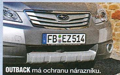
OUTBACK má ochranu nárazníku.

prostupnost terénem, vzrostla na 200 mm. To je mnohdy lepší hodnota než u klasických vozů kategorie SUV. Subaru Outback je opravdu schopným vozem, vyzkoušeli jsme s ním brod, křížení náprav, výrazné stoupání i rychlou jízdu po šotolině. Stejně jako modely Legacy je zaměřen především na maximální komfort pro posádku. V zatáčkách se tak více naklání, ale nezná, co to je slovo nerovnost. Symetrický pohon všech kol funguje na sto procent a pod kapotou můžete mít