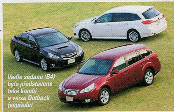
Vedle sedanu (B4) bylo představeno také kombi a verze Outback (vepředu)

V Japonsku se začala prodávat zcela přepracovaná čtvrtá řada Subaru Legacy. Nový je jak sedan, tak kombi.