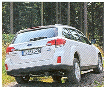
Světlost 200 mm a velké nájezdové úhly zaručují outbacku dobrou průchodnost terénem. Karoserie se ani na velkých nerovnostech nekroutí. Zavazadelník narostl o 67 l na 0,526 m 3 .

Legacy a Outback přidaly na komfortu. Sice přišly o bezrámové dveře, získaly však prostornější kabínu a pohodlný podvozek.