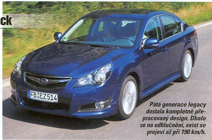
Pátá generace legacy dostala kompletně přepracovaný design. Dbalo se na odhlučnění, svist se projeví až při 190 km/h.

V souladu s trendem doby Subaru Legacy a Outback celkově narostly. Zároveň dostaly komfortnější podvozek, rozsáhlejší výbavu a lepší jízdní vlastnosti.