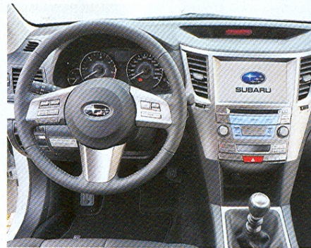
Ve výbavě nechybí samočinná parkovací brzda a hill-holder. Ten na rozdíl od konkurence drží vůz ve svahu do chvíle, než řidič šlápně na plyn, nikoli pouhé tři sekundy.