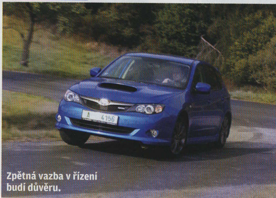
Zpětná vazba v řízení budí důvěru.