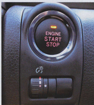
▲ Bezklíčový přístup a startování tlačítkem jsou ve standardní výbavě