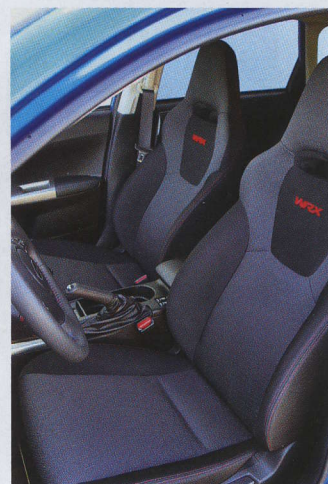
▶ Sportovní sedadla s vyšitým nápisem mají perfektní boční vedení