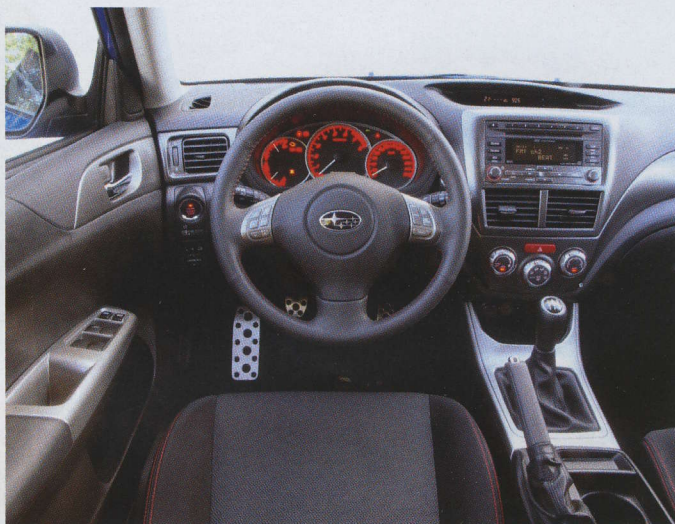
▲ Tvrdé černé plasty patří k Impreze stejně jako skvělá ergonomie řídicího pracoviště

Do standardní výbavy patří i xenonové přední světlomety, samočinná klimatizace, audiosystém s měničem na šest CD, tempomat, bezklíčové otevírání a startování tlačítkem. Stačí si tedy připlatit pouze necelých 12 tisíc korun za metalický lak a již nemáte nad čím přemýšlet, protože například navigační systém a bluetooth handsfree nebo systém SI-drive je určen výhradně pro model WRX STi.