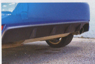
▲ K modelu WRX patří zadní difuzor a patřičně tlustá koncovka výfuku...

Komu nestačilo standardní provedení Imprezy WRX a model STi mu přijde příliš ultimativní, má nyní možnost pořídit si další WRX 265 s výkonem předposlední generace STi.