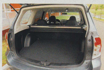
Zavazadelník pojme 0,450 až 1,660 m 3 . Zadní opěrada se dají lehce naklápět.

Z vozu je dobrý výhled všemi směry. Správně dlouhá a rozměrná sedadla preferují vzpřímený posaz, ani po dlouhé jízdě z nich záda nebolejí. Chválíme rozmístění ovladačů, prostornou kabinu a rozsáhlou výbavu, která mimo jiné obsahuje stabilizační systém, šest airbagů,