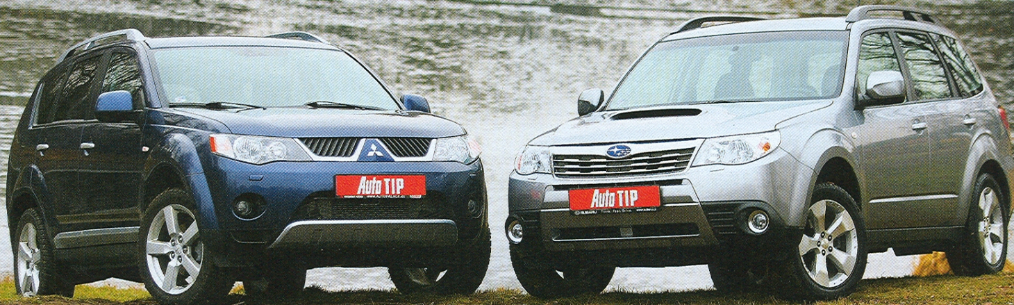
Outlander vypadá výrazněji než forester, ten má zase lepší terénní předpoklady – světlost 215 mm proti 205 mm, větší nájezdové úhly a kratší rozvor

Japonská SUV Mitsubishi Outlander a Subaru Forester